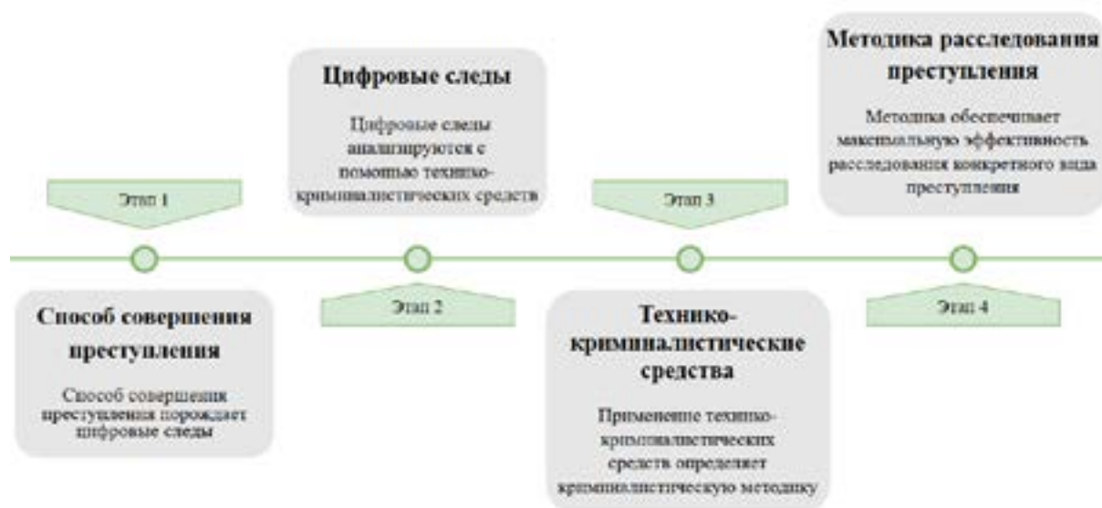
Рис. Упрощенная модель последовательности этапов расследования преступления (на примере преступления в сфере компьютерной информации)

ба совершения преступления должно закономерно влиять на все последующие этапы, обеспечивая их непрерывное совершенствование.