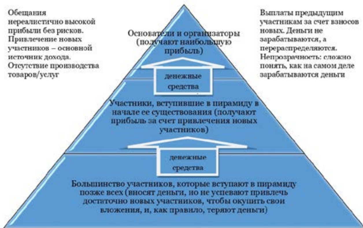
Рис. Основные элементы финансовой пирамиды

ное распределение национального богатства государства, торможение экономического роста за счет изъятия средств из оборота, утечка капитала в иностранные банки [4; 5].